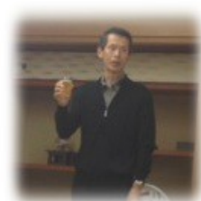
よろしくお願ひします 内山会長エク外