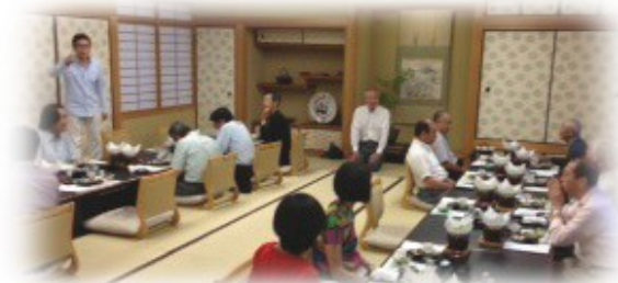
6/22 祇園花郷において