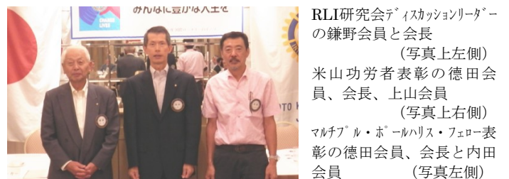
RLI研究会フェイスカッションリーダーの鎌野会員と会長 (写真左上側) 米山功労者表彰の徳田会員、会長、上山会員 (写真右上側) マルチプル・ホールハリス・フェロー表彰の徳田会員、会長と内田会員 (写真左側)