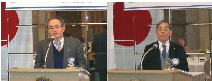
上山社会奉仕委員長 松尾国際奉仕委員長