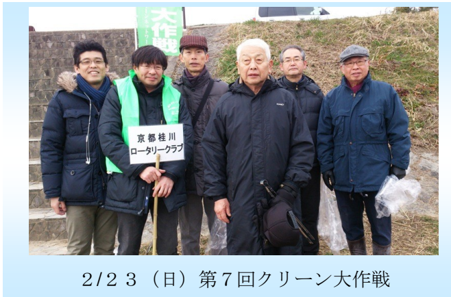
2/23 (日) 第7回クリーン大作戦