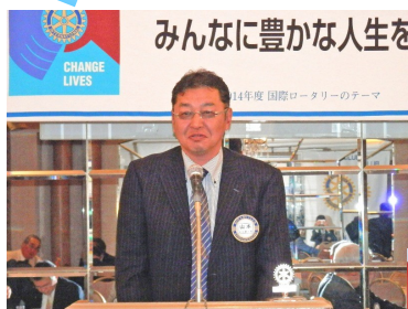
みんなに豊かな人生を