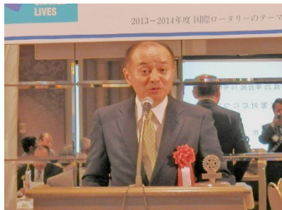
「台風18号(平成25年9月16日)の被害概要等について」