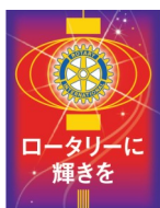
「ロータリーに輝きを」 -Light Up Rotary- 2014~15RIテーマ ゲイリーC.K.ホアンRI会長