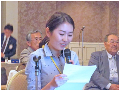
クラブ・デー 第9回クラブ討論会 「米山奨学生スピーチ」