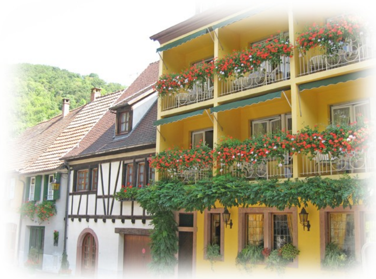
「フランス アルザス地方」