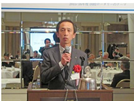
「市民を守る『新・消防指令システム』」