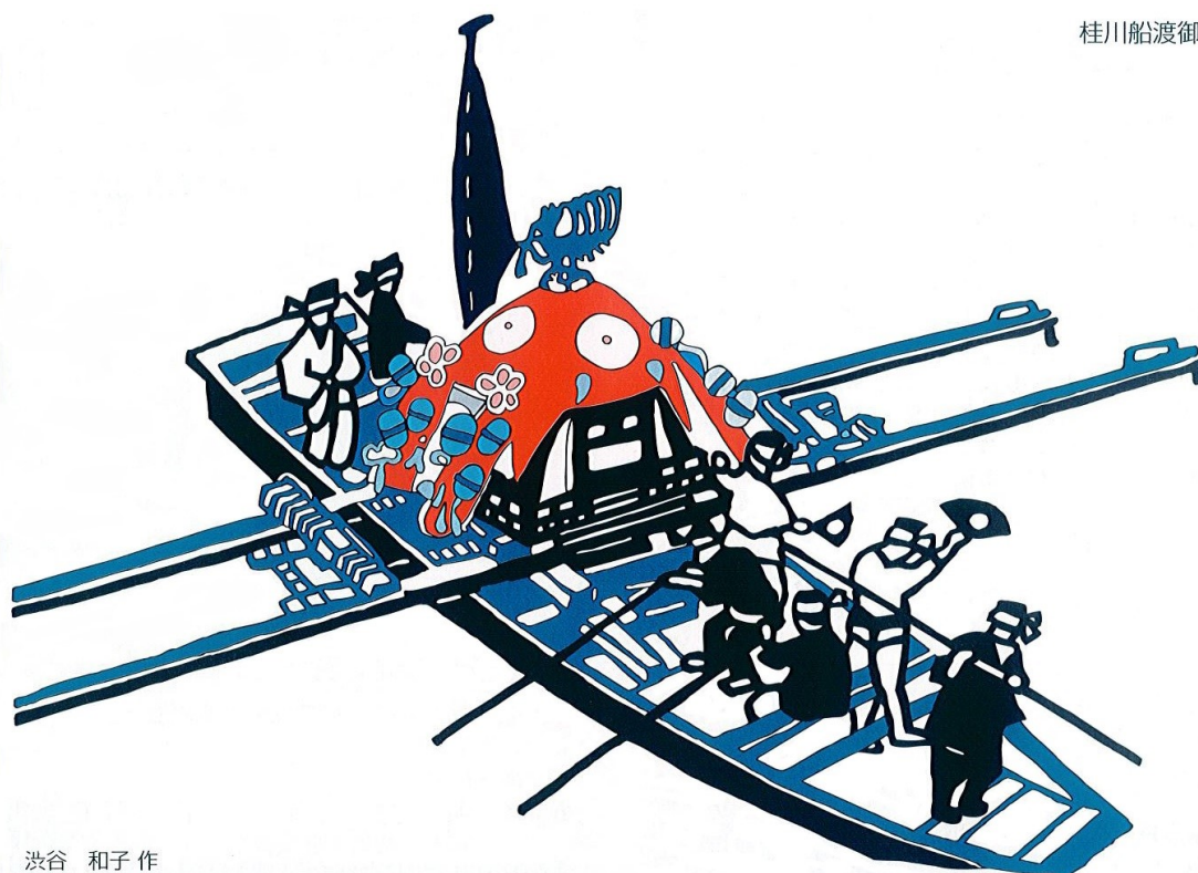
渋谷 和子 作