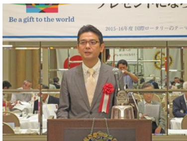
『「時間から命へ」・・・労働相談の現場から・・・』