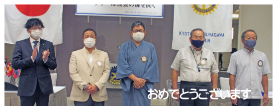
5・6月会員誕生日お祝い