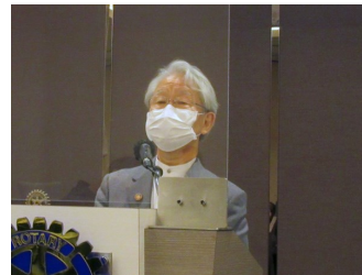
「次年度第1回クラブ協議会」 (年間計画)