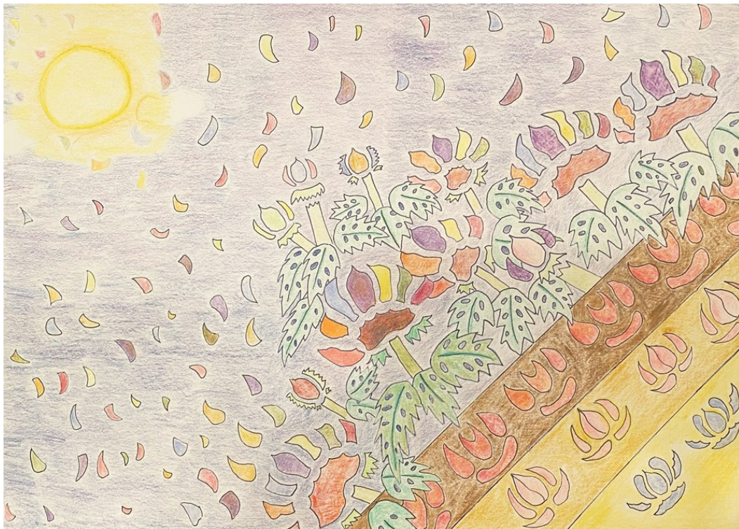
社会福祉法人 新明塾 山科教室 ju:彩ギャラリー 「植物模様」 ossiiさん