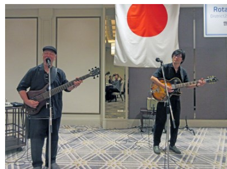
クラブ・デー「真昼のブルース」

【トルコ・シリア大地震 復興支援 募金箱】 小計 1,000円 累計 3,000円