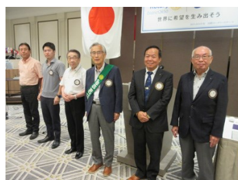
8月会員誕生日お祝い