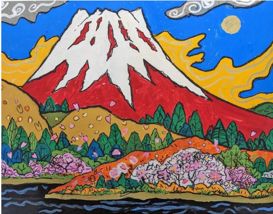
一般社団法人 京都府あおぞら会