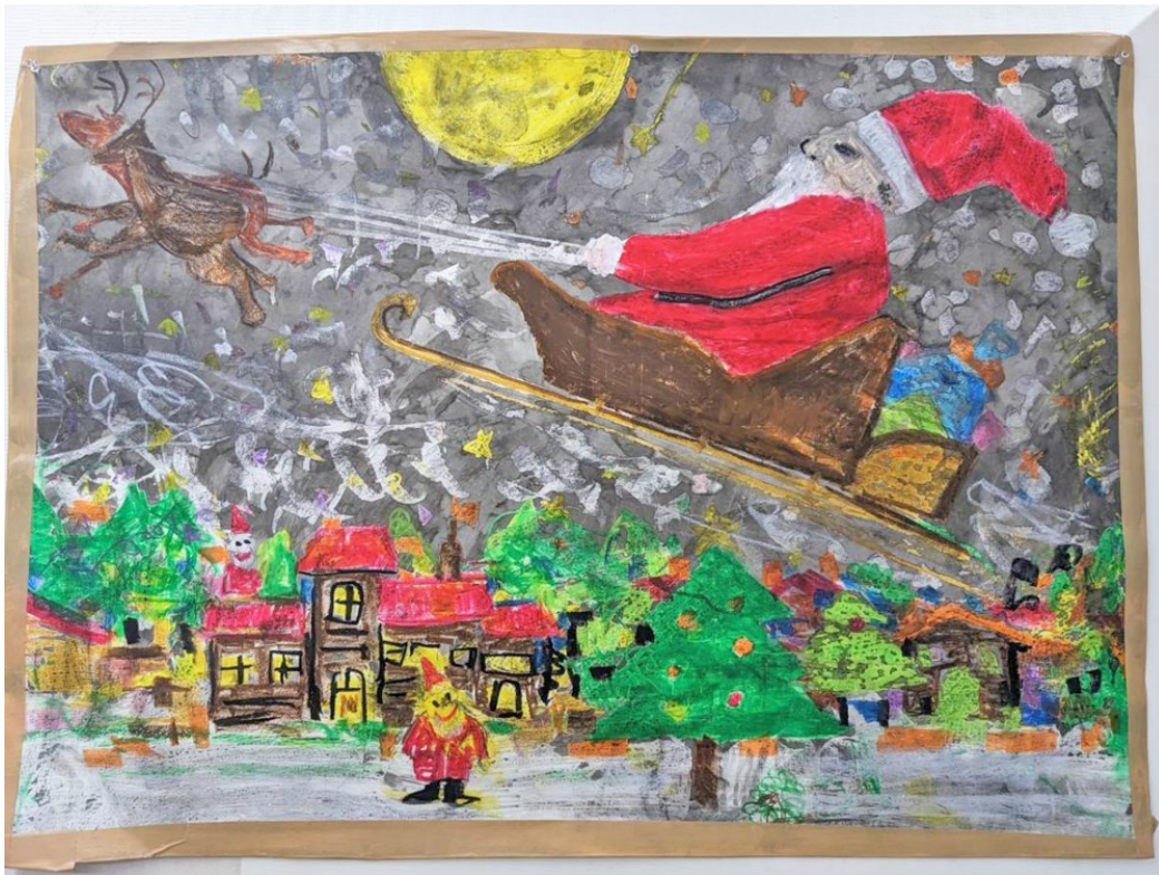
一般社団法人 京都府あおぞら会