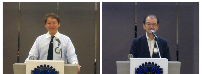
飛弾青少年奉仕副委員長