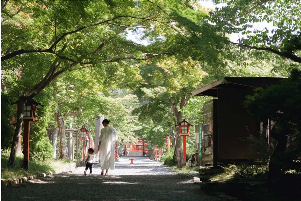
「ママと散歩 大原野神社参道」