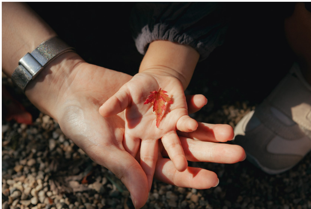
「小さい秋」