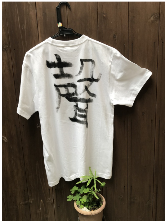
Ju:彩ギャラリー 「聲」 I k u e